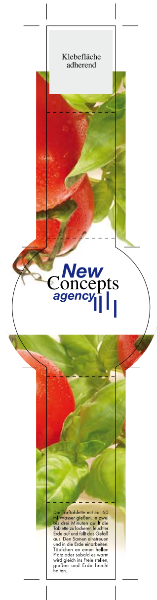
Gestaltete Standzeichnung designed stand drawing

You will receive a proof for approval. Please check this carefully for text, motif, position and colours.